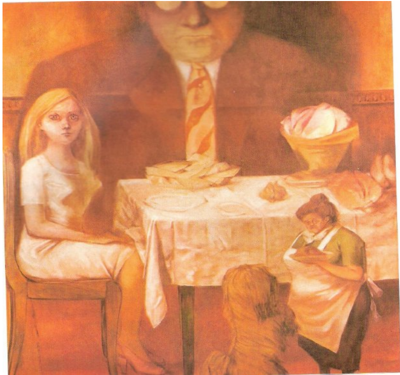
Dorothea Tanning (1954): Familienporträt