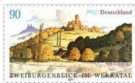
Briefmarke mit dem Zweiburgenblick im Werratal

Es wurde auch eine Tageswanderung entlang der innerdeutschen und heute der hessisch-thüringischen Grenze durchgeführt. Zuerst ging es über den ehemaligen Grenzfluss Werra durch den Wald - etwa entlang des Kolonnenweges von der Burg Ludwigstein zur Burgruine Hanstein im benachbarten Thüringen. Nach der Mittagspause auf der „Teufelskanzel“, die schon Theodor Storm besuchte, ging es über die Ortschaft Lindewerra, in der sich das Stockmachermuseum befindet, zurück auf die Burg Ludwigstein. Bei einer solchen Wanderung kommen die Naturfreunde auf ihre Kosten und man kann viel über die Bedeutung der mittelalterlichen Burgen und die neueste deutsch-deutsche Geschichte lernen.