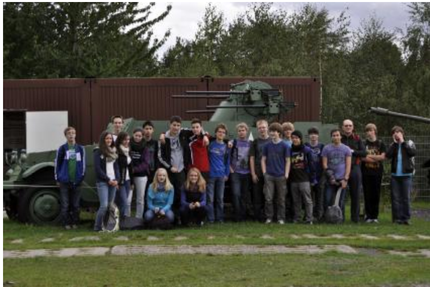
Schifflersgrund: Originalfahrzeuge hautnah. Die Klasse erlebt eine spannende Führung

Viele Fragen zur DDR-Geschichte, wie z. B. über den Grenzverlauf, den Dienst der NVA-Soldaten oder den Alltag an der ehemaligen Grenze interessierten die Schüler der Einführungsstufe der WvO im Vorfeld der Fahrt. Mit dem Besuch im Grenzmuseum Schifflersgrund bei Bad Sooden-Allendorf wurden viele dieser Fragen beantwortet.