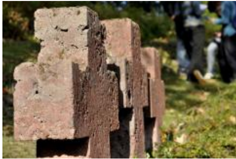
Nachdenken über den Krieg und seine Opfer (Kriegsgräberstätte Ludwigstein)

Um zu verstehen, welche Schrecken der Zweite Weltkrieg für Ältere bedeutet hat und auch was er für unsere Generation heute noch bedeutet, wurde der Gruppe die Arbeit des Volksbundes Deutsche Kriegsgräberfürsorge in mehreren Präsentationen vorgestellt.